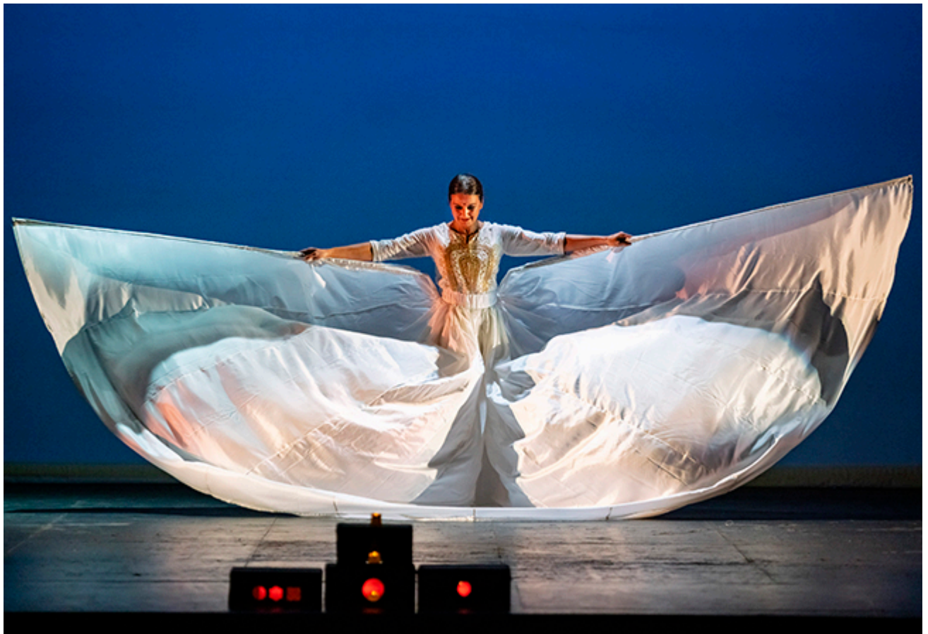
« Bhakti ». Poesía del cuerpo

« Bhakti. Poesía del cuerpo ». En el Teatro Zorrilla, Valladolid